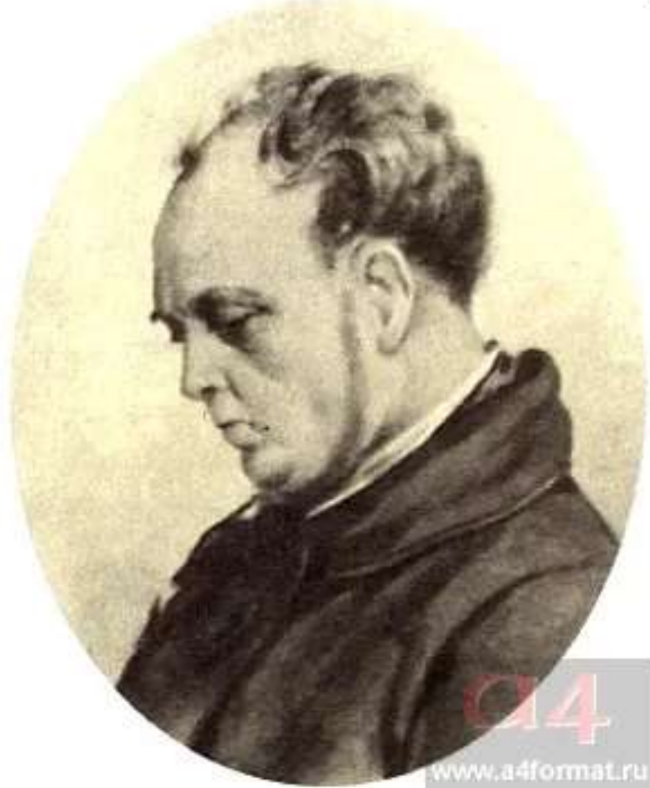
НИКОЛАЙ ПЕТРОВИЧ КИРСАНОВ