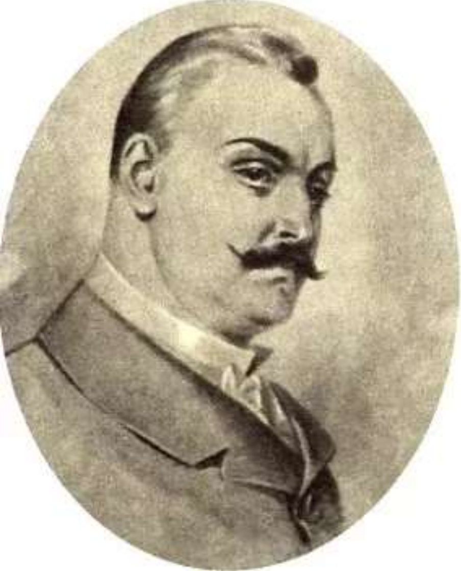
ПАВЕЛ ПЕТРОВИЧ КИРСАНОВ