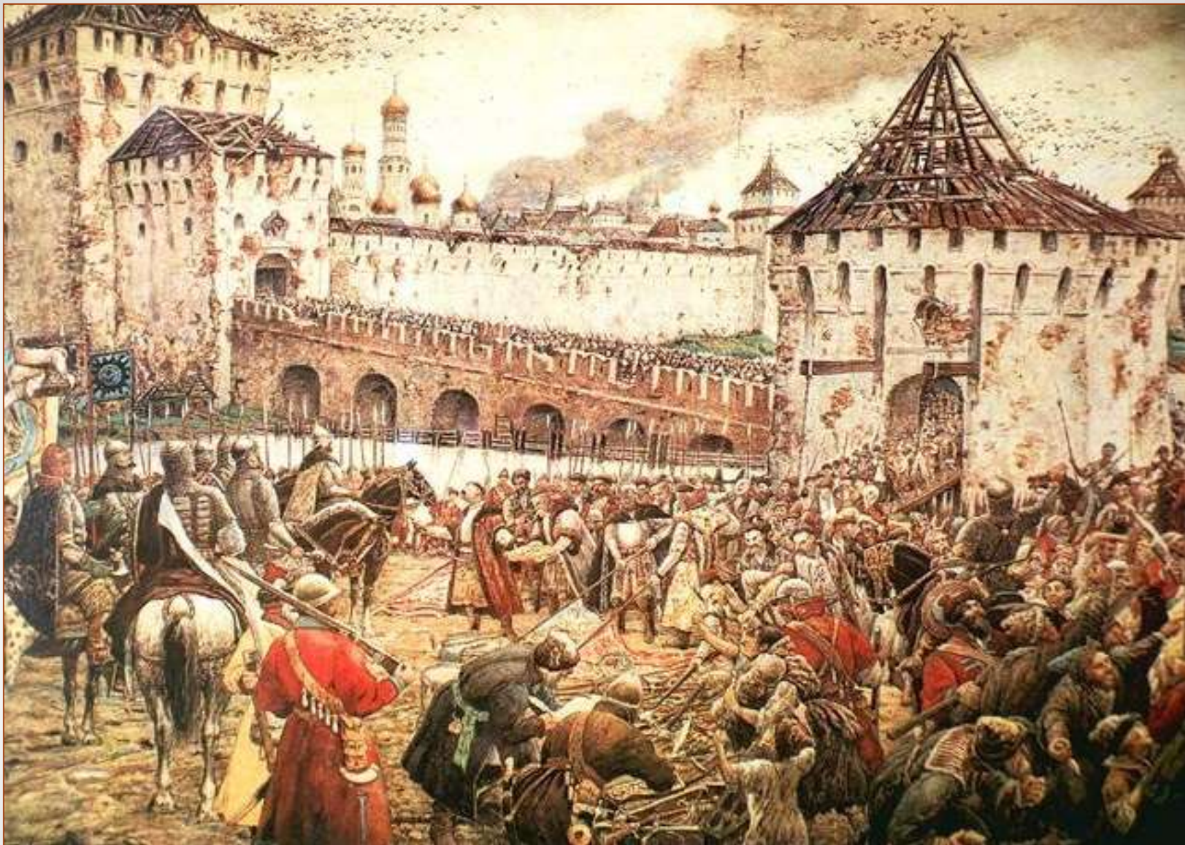
Изгнание польских интервентов из Московского Кремля в 1612 г.